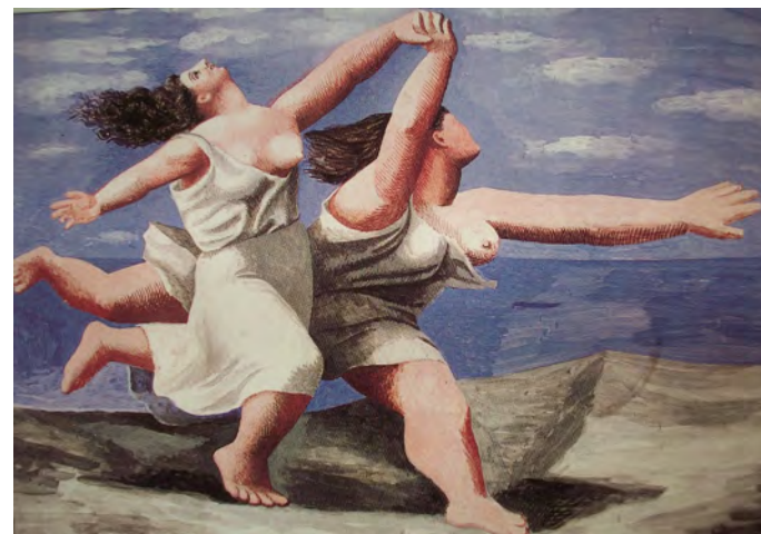
Clarissa Pinkola Estès « Femmes qui courent avec les loups »

« Chaque femme porte en elle une force riche de dons créateurs